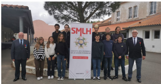
Capbreton 11 mai 2023 Collège Saint-Joseph