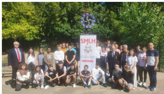
Mont-de-Marsan 2 mai 2023 Collège Jean Rostand