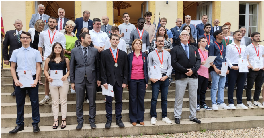
A Mont-de-Marsan dans les jardins de la préfecture, les étudiants et apprentis primés et les autorités

Ensuite se sont succédé pour recevoir leur prix, en l'occurrence un diplôme accompagné d'un chèque ou d'une médaille, 23 jeunes issus des lycées ou des centres de formation professionnelle. La cérémonie a été close par un agréable buffet fructueux et des échanges avec les étudiants, les accompagnants et les organisateurs