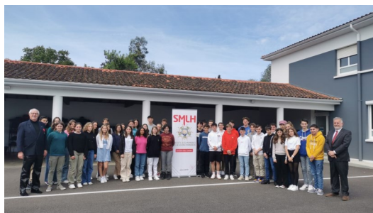
Saint-Sever 27 avril 2023 Collège Sainte-Thérèse