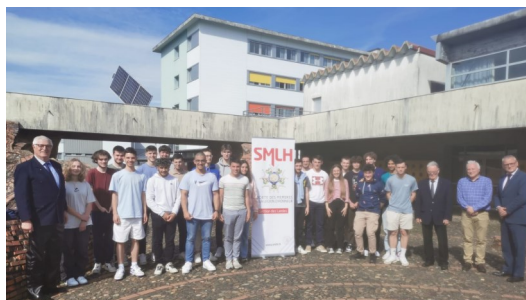
Aire-sur-Adour 27 avril 2023 Lycée Gaston Crampe