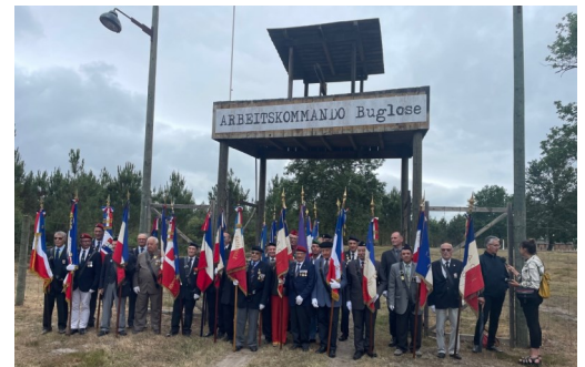
Les drapeaux des associations patriotiques 25 juin 2022 à Buglose