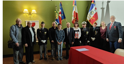
Après la remise du prix, en famille