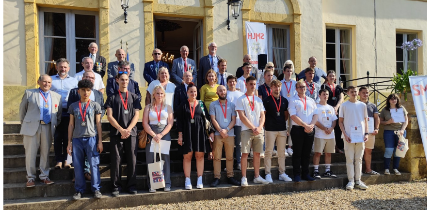
Apprentis et lycéens méritants lors de la remise des prix en préfecture le 11 juillet 2024