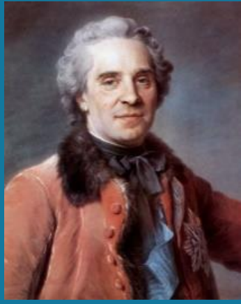
Maurice de Saxe (portrait de Maurice-Quentin de La Tour, vers 1750-1760)

Maurice de Saxe , fils naturel du Roi de Pologne Auguste II, promu Maréchal en 1743, est à l'origine de la fondation de cette École Royale Militaire destinée à la formation militaire et pédagogique de la jeunesse "noble" souvent désargentée. Durant la guerre de Succession d'Autriche, il a pu constater que les régiments royaux manquaient d'officiers bien formés.